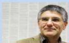
On. PAOLO COVA, Deputato PD Commissione Agricoltura della Camera dei Deputati